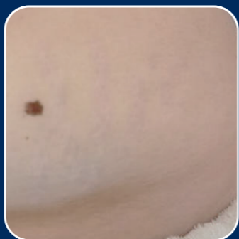
Strie po štyroch aplikáciách. Zjazvené tkanivo sa výrazne zmenšilo.