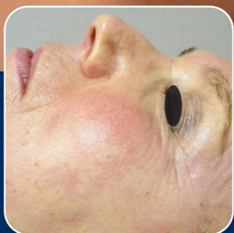
Vrásky v okolí očí a oblasť lícných kostí po jednej aplikácii.